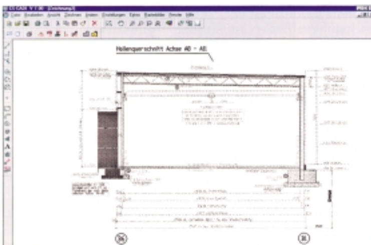
Querschnitt durch die Halle

Mit dem Optimierungsprogramm der CSI konnten die Bauingenieure schnell berechnen, welches Fachwerksystem am wirtschaftlichsten ist. Hierbei beschränkt sich die Aufgabe des Anwenders darauf, die Randbedingungen für Geometrie, Bemessung und Belastung einzugeben. Bei der Geometrie benötigt das Programm lediglich neben der Angabe von Stützweite und Binderabstand nur eine Diagonalanordnung. Diese können aus einer Vielzahl von vordefinierten Formen per Mausclick im Programm ausgewählt werden. Gleiches gilt für die bei der Optimierung zu berücksichtigenden Materialien inklusive Kosten, Querschnittsarten und Belastungen. Auf Knopfdruck wird die wirtschaftlichste Lösung angezeigt. Dabei erfolgt eine Bemessung inklusive Knicksicherheitsnachweis.